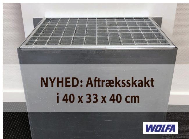
Aftræksskakten måler: 40 x 40 x 33 cm (b x h x d)