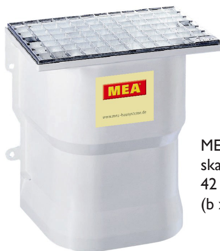
MEA udluftningsskakten måler: 42 x 42 x 25 cm (b x h x d)

Vi leverer ventilationsskaktene med beslag til montering på kældervæggen. Du kan vælge en rist med maskestørrelse 30/10 eller 30/30. Ventilationsskaktene kan forhøjes ved at placere dem oven på hinanden. Aftræksskakten opfylder kravene til aftræk fra de nye empfang.