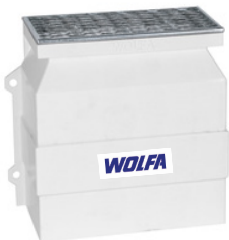
Wolfa udluftningsskakten måler: 36,5 x 40 x 20 cm (b x h x d)